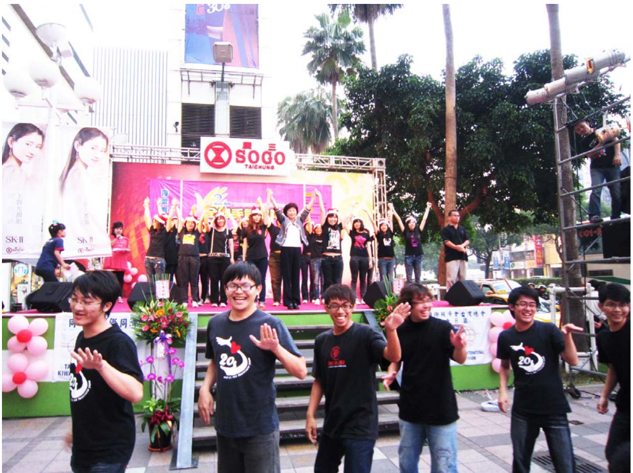
南台科技大學於全國手語決賽中獲得佳績！

比賽，並不是學習的終點，而是服務與回饋的開始，經過了激戰，希望大家都能秉持學無止盡的精神，合力建構聽障者無障礙的溝通環境，讓聽障者走出陰霾、迎向陽光！