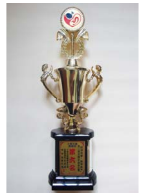
(大專團體第 6 名)