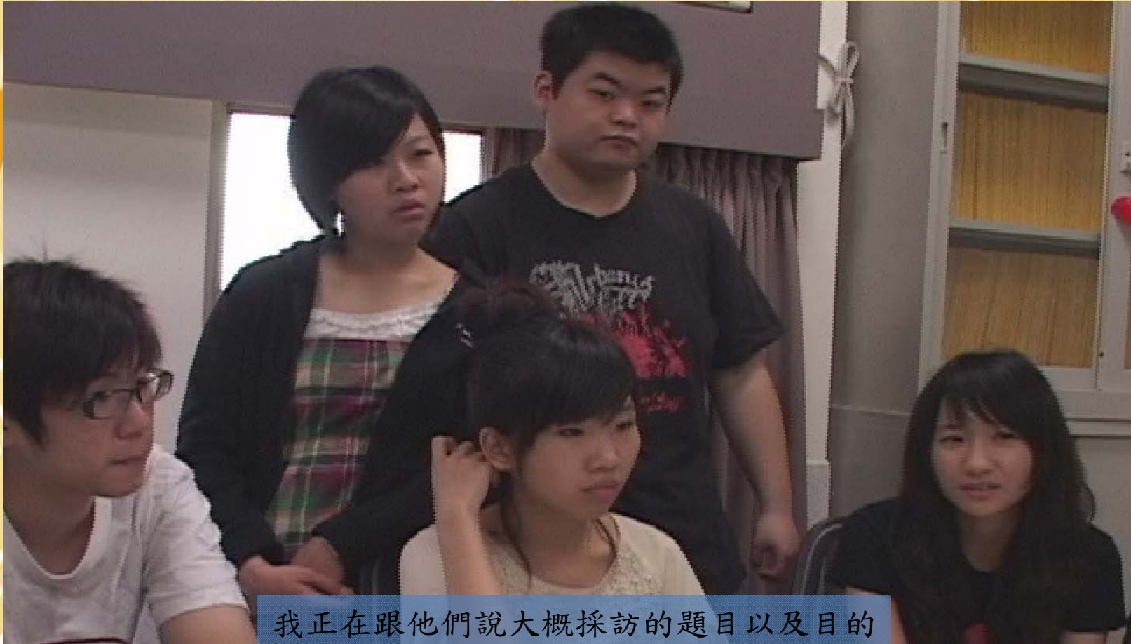
我正在跟他們說大概採訪的題目以及目的