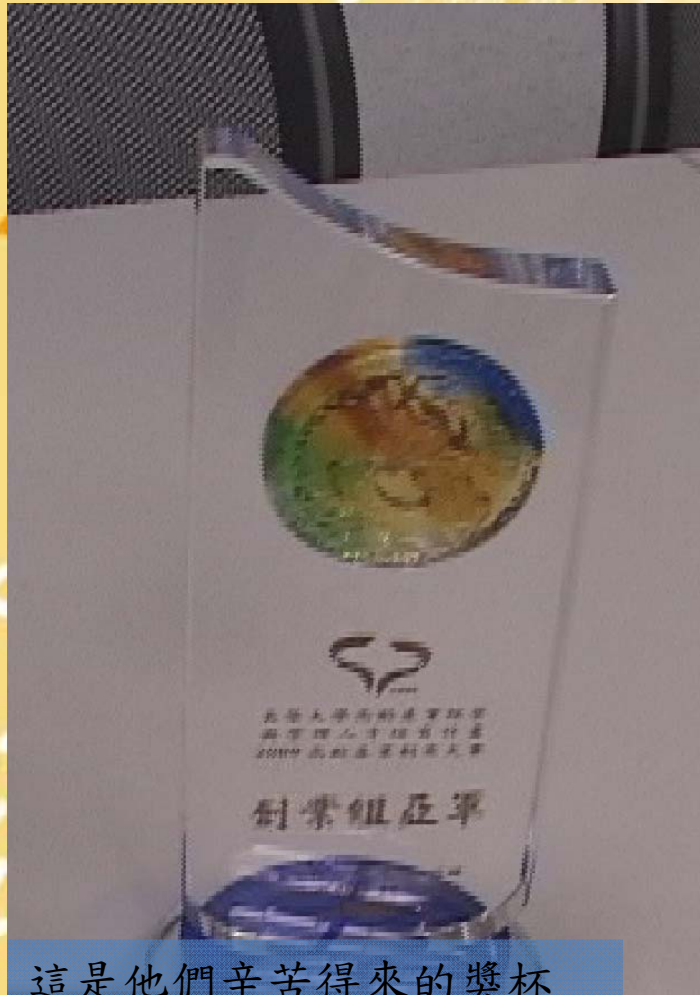
這是他們辛苦得來的獎杯

今天主要是要學習如何採訪，在這次的採訪中看到了很多努力的學生，或許大家都覺得大學生都沒在幹嘛，但是這群學生都很為自己的將來努力，對他們來說現在參加比賽是為了以後可以更好的出路，也不會覺得比賽是如此的辛苦，更特別的是在比賽過程中，學習到很多對於團體以及自己該如何表達方面，這是一群很有活力以及熱情的人。