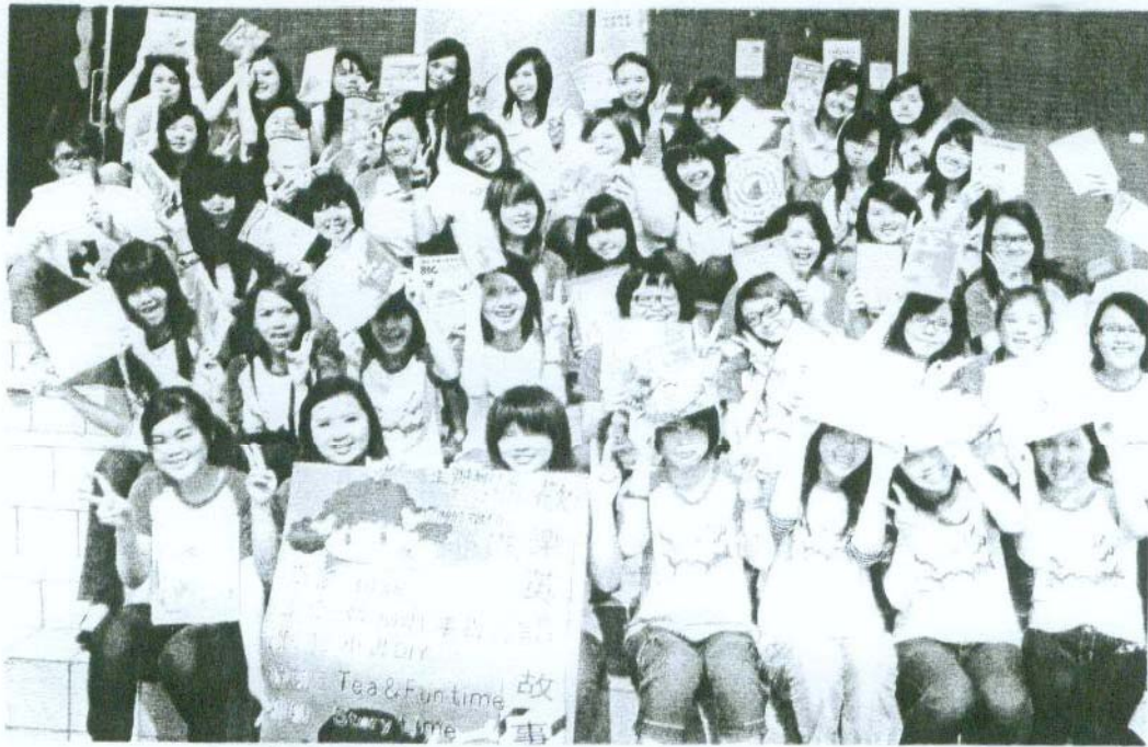
↑南台科技大學應英系昨天舉辦「歡樂英語故事週末營」活動。