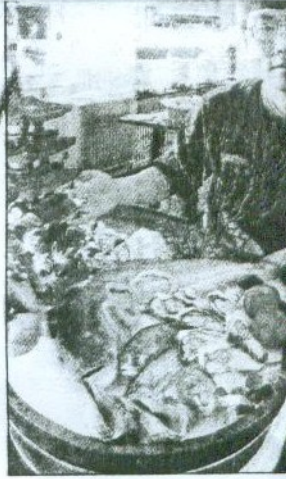
↑ FOCUS十二樓上閣 新開幕，供應生蠔等 海產。

的表 得到台 灣的國 心的文 心，一 敢交流 孤立。 台末代 一〇六 為達鄭成 為例說 ，也是 節的目 動是他 郡王祠 拜鄭成 成功的